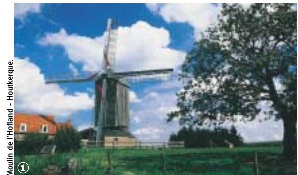
Moulin de l'Hofland - Houtkerque.

Bocage Flamand et marais Audomarois, au fil de l'Yser