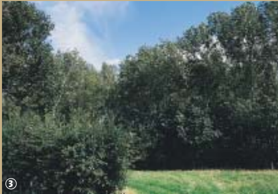
Bois Saint Acaire.

Houtkerque, séparé de la Belgique par l'Yser, possède comme son nom l'indique, « hout » bois et « kerque » église, une église en bois. En effet, l'église Saint-Antoine, reconstruite au XVI e siècle, était à l'origine constituée d'une nef unique bâtie en bois et en torchis. Cette hallekerque est aujourd'hui formée de trois vaisseaux couverts d'un lambris et précédés d'un élégant clocher-porche. Sa tour gothique, visible de la mer, servait autrefois de repère aux navigateurs. L'autre joyau architectural de la commune, également en bois, est l'Hofland Meulen, un moulin sur pivot à deux étages, récemment restauré, célèbre pour le dicton flamand qui y est inscrit : « Puise à ton avantage et crains le jugement de Dieu ». Il fut construit au XVIII e siècle mais certains le considèrent comme l'un des plus anciens d'Europe, une de ses poutres portant gravée la date 1114. Il abrite un petit musée où sont exposés d'anciens outils de meunier. Vu l'exploitation qu'il en est fait, le bois devait être l'une des ressources du village et effectivement Houtkerque a conservé la physionomie d'un petit village rural boisé