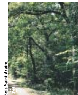
Bois Saint Acaire.

La version longue est plutôt adaptée à un public averti. La RD 947 est traversée à quatre reprises. Si la visibilité est bonne les trois premières fois, la traversée après le point 6 demande plus d'attention. Les parties d'itinéraires labourées (dans l'attente de travaux d'aménagement) peuvent être empruntées sans crainte : bien suivre le balisage. En période de pluie, porter des chaussures étanches.